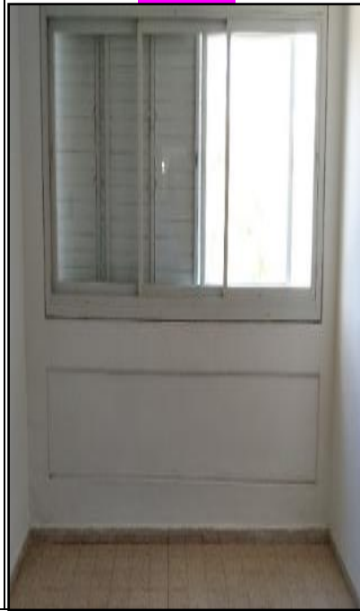
נבדק: לא אסבסט