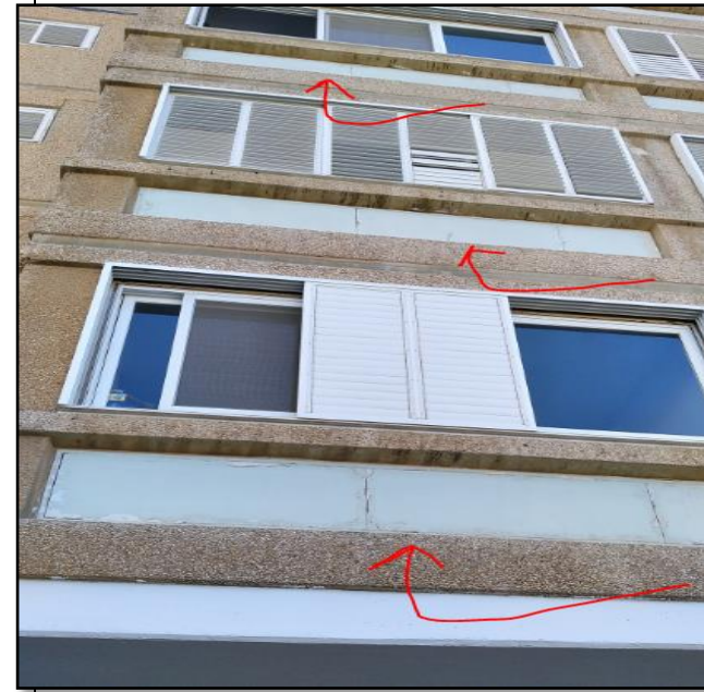
מעונות סגל זוטר, בניינים #901-#906