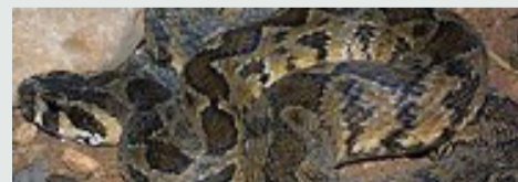
צפע ארצישראלי צבעו בגוון אזור מחייתו, גוון אפור עד חום-צהבהב. על גבו מעוינים מחבורים (הנראים כפס עקלתון).

הסימנים העיקריים המבדילים בין השניים הם צורת מטבעות כהים המופרדים אחד מהשני על גבו של זעמן המטבעות, בניגוד למעוינים המחבורים זה לזה אצל הצפע הארצישראלי. גופו של זעמן המטבעות דק יותר וזנבו ארוך ומחודד יותר. זעמן המטבעות הינו נחש פעיל יום, בעוד הצפע הארצישראלי הוא בעיקר נחש לילי.